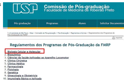
Figura 4: Após acessar o link de normas e regimentos ( http://posbiocel.fmrp.usp.br/pt/normas/ ), é possível acessar tanto o Regimento da Pós-Graduação (Resolução nº7493) quanto todos os Regulamentos dos Programas de Pós-Graduação da FMRP. Este link, encaminha para a opção do Regulamento do Programa de Biologia Celular e Molecular (Resolução nº7729).